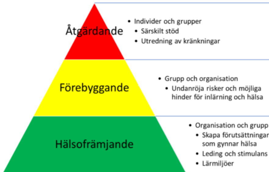
Figur 1: Modell för elevhälsa (Elevhälsokonsulterna, 2019)