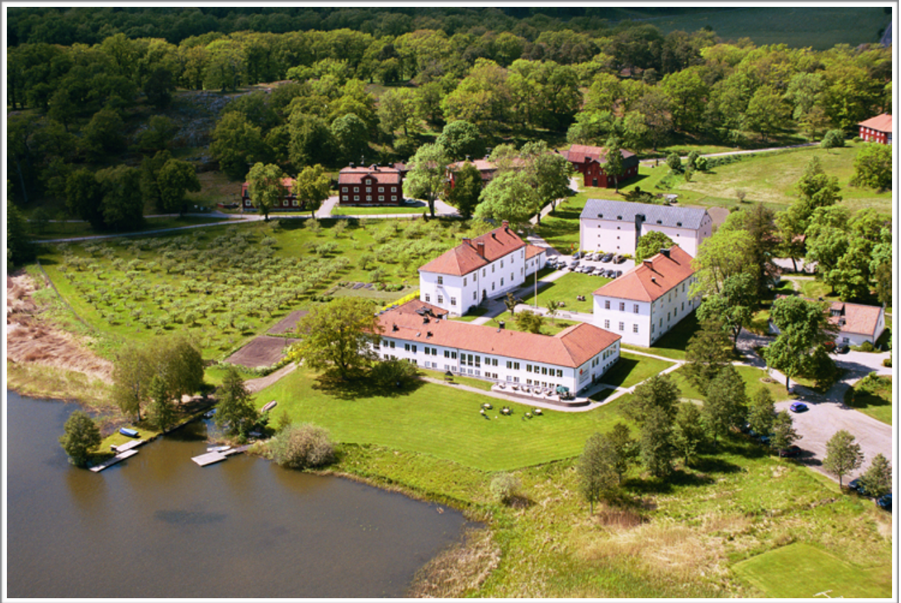
Flygfoto över Gripsholmsskola och Gripsholms förskola