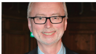
Dick Harrison föreläste om digerdöden.

RIKSSALEN PÅ SLOTTET i Mariefred var fullsatt och Dick ledde den förväntansfulla