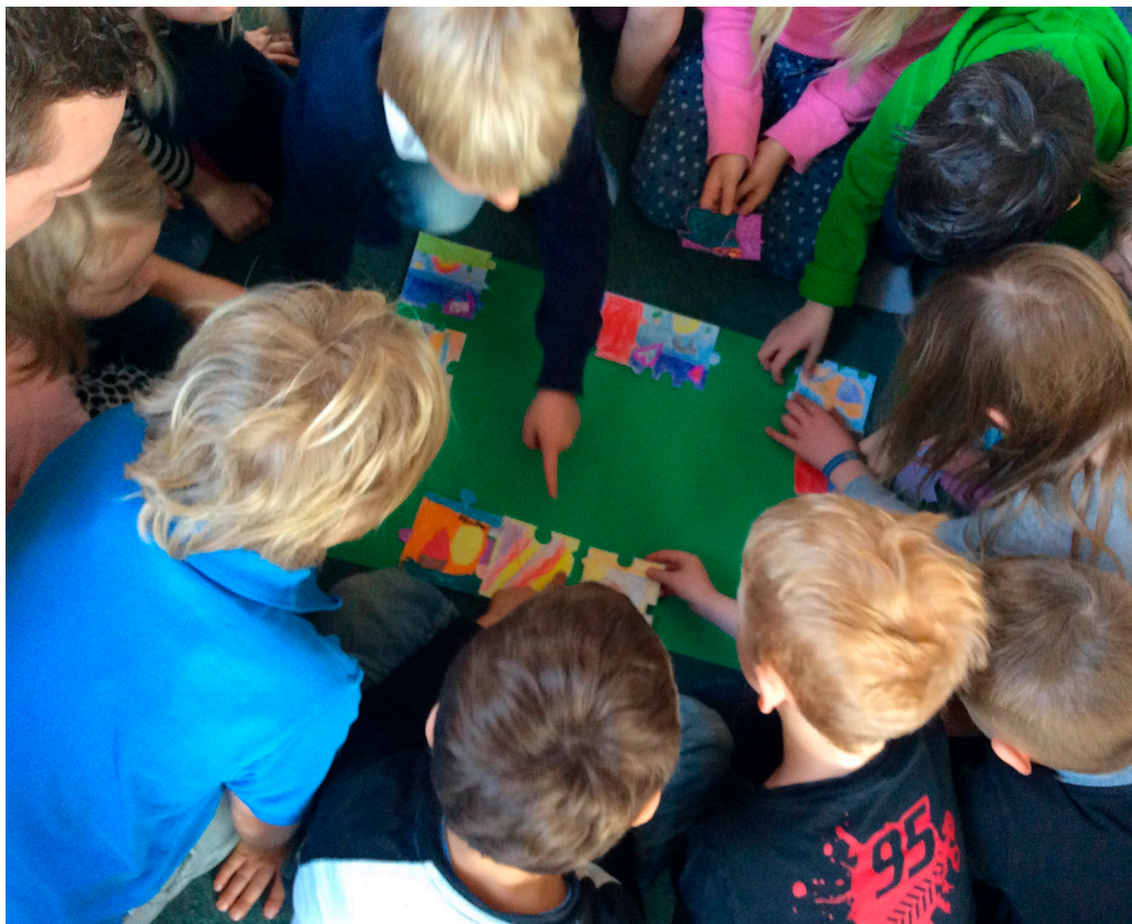
Alla barn fick tillsammans bygga ett pussel.

- Vi har tagit tillfället i akt att prata om olikheter över lag, att vi är olika på många sätt. Vissa saknar hörsel och andra talförmåga, en del vill prata mycket och andra vill inte prata alls. Vi ser olika ut, man kan ha två armar, men också en arm. Vissa behöver en rullstol för att komma fram, andra behöver inte det. Oavsett - ska alla vara med! Alla är värdefulla och har en plats.